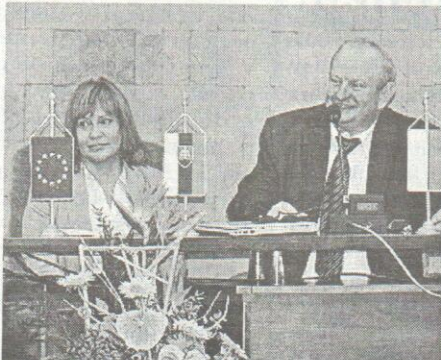
Úvodná konferencia na Univerzite Mateja Bela v B. Bystrici