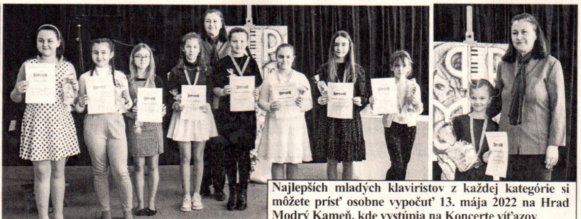
Najlepších mladých klaviristov z každej kategórie si môžete prísť osobne vypočuť 13. mája 2022 na Hrad Modrý Kameň, kde vystúpia na Koncerte víťazov.