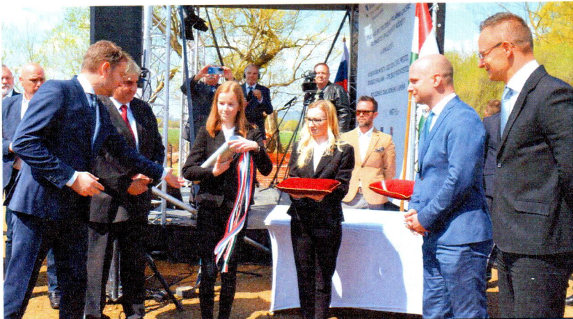
Na foto zľava Igor Matovič, Mihály Balla, Gábor Grendel a Szijjártó Péter vložili do časovej schránky slovenské a maďarské mince, maďarské noviny aj náš Pokrok. Niekedy v budúcnosti, keď sa táto časová schránka otvorí, bude svedectvom toho, čo sa u nás v roku 2022 dialo...

Za slovenskú stranu Igor Matovič zdôraznil to, že výstavba mosta je synonymom priateľstva medzi štátmi, ktoré môže byť veľmi krehké, o čom sme sa presvedčili 24. 2. 2022. Povedal: „Mali by sme si vážiť mier, ktorý nám tu dneska vládne a robiť všetko, aby trval dlhé roky. Dnešný deň a položenie kameňa je o to dôležitejšie, že na území nášho východného suseda – Ukrajiny, padajú bomby, zomierajú ľudia a búrajú sa už postavené mosty...“